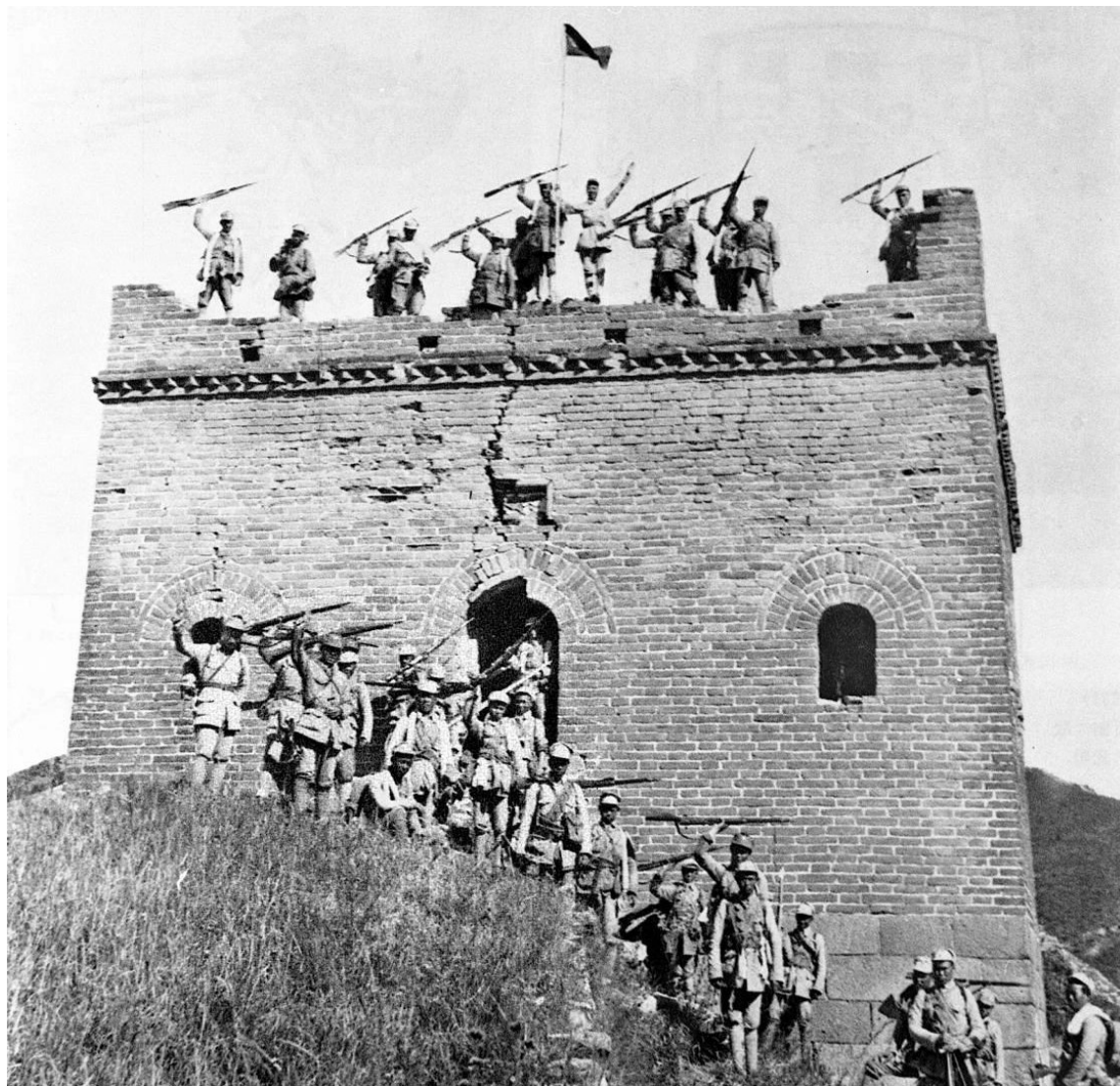
（百团大战中，八路军攻克涞源县日军据点东团堡）