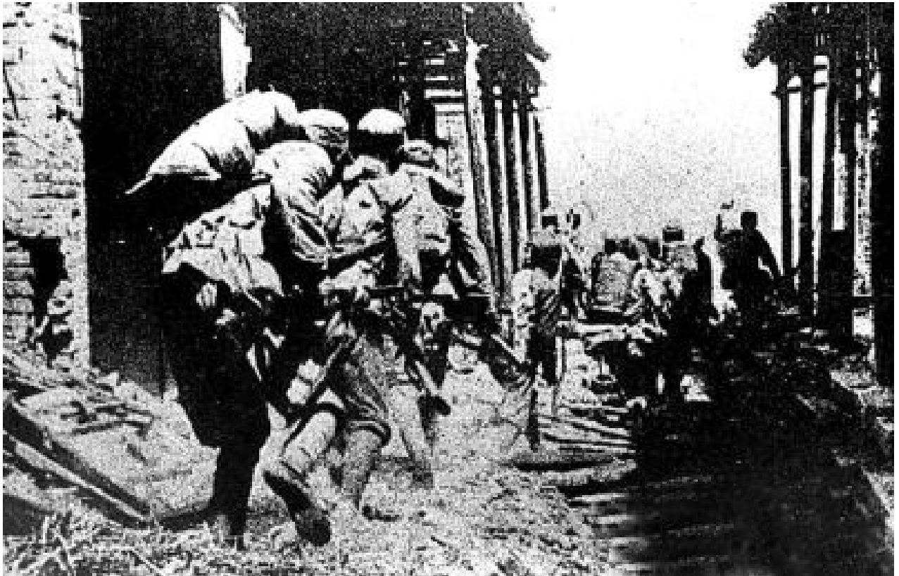
（中国军队在台儿庄与日军展开激烈巷战）

从平型关大捷到台儿庄战役 日军速亡中国的迷梦被击碎 “日军不可战胜”的神话被打破 侵略者每前进一步 都要付出惨重的代价